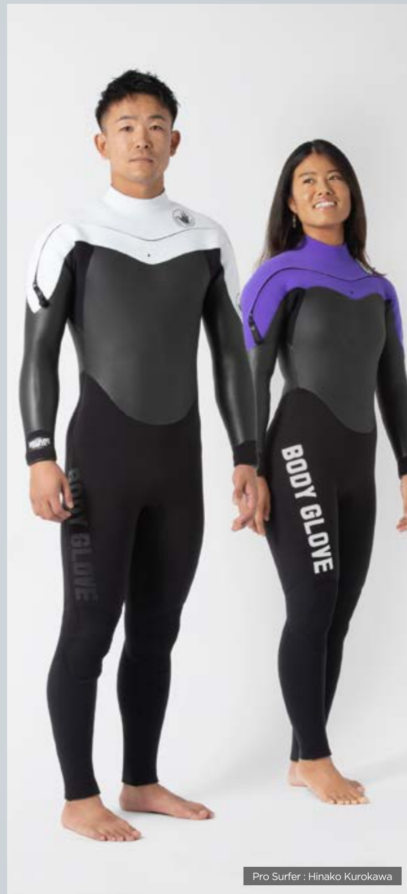
Pro Surfer : Hinako Kurokawa

※3mm,5/3mm,5mmから選択 オーダー料金は¥8,000 ¥8,800(税込み)